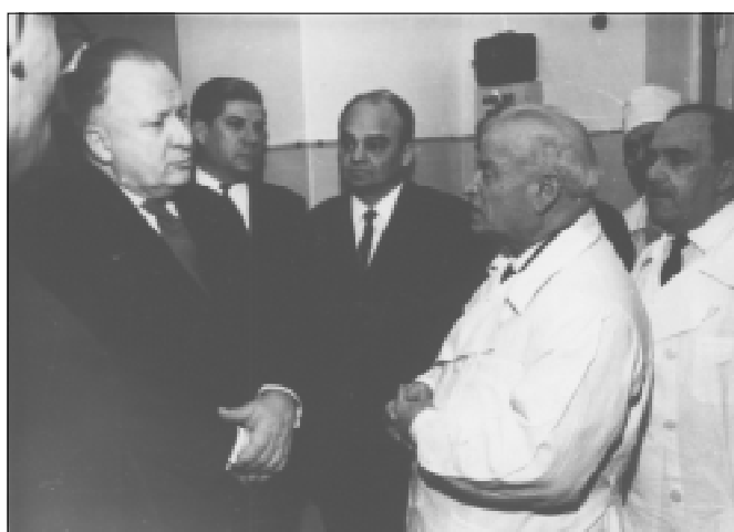
З міністром охорони здоров'я СРСР академіком Б.В. Петровським під час його перебування у Київському медичному інституті