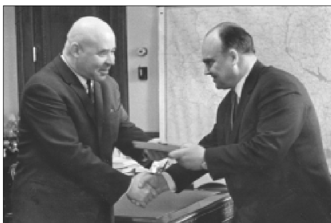
В.І. Мілько з першим секретарем ЦК Компартії України П.Ю. Шелестом, 1963 р.