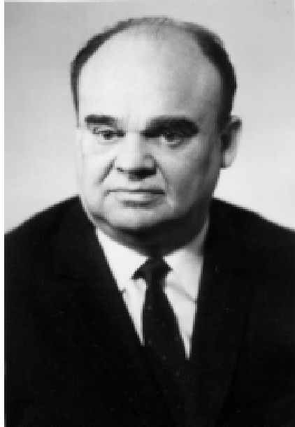
Професор В.І. Мілько (1921–1998)

У травні 2011 р. минуло 90 років від дня народження легендарної особистості, ветерана Великої Вітчизняної війни, активного учасника ліквідації наслідків аварії на Чорнобильській АЕС у 1986 р., визначного вченого-радіолога, блискучого організатора підготовки медичних кадрів, талановитого педагога, ректора Київського медичного інституту ім. О.О. Богомольця (1965–1970), завідувача кафедри рентгенології і радіології (1966–1990), заслуженого працівника вищої школи УРСР, лауреата Державної премії УРСР в галузі науки і техніки, доктора медичних наук професора Василя Івановича Мілька (1921–1998).