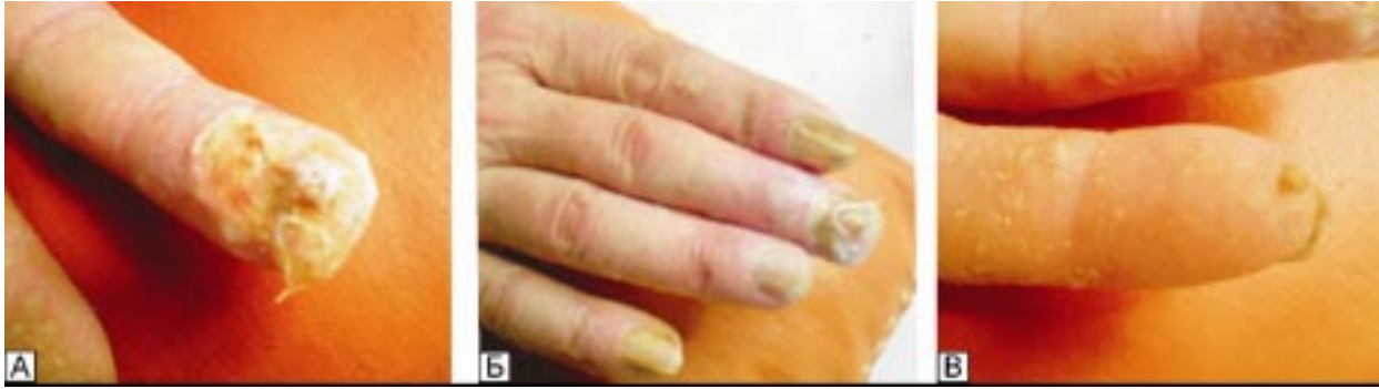
Рисунок 1. Фото пальців кисті правої руки хворого З.: А — хронічна променева виразка на долонній поверхні нігтьової фаланги III пальця; Б — тильна поверхня нігтьової фаланги III пальця: затримка зростання нігтя і руйнація нігтьового ложа з гіперкератозом; В — хронічний променевий гіпертрофічний дерматит на долонній поверхні IV пальця