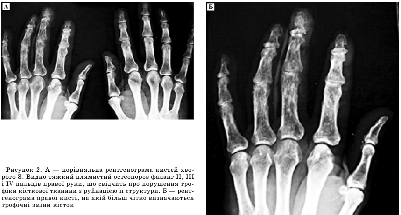
Рисунок 2. А — порівняльна рентгенограма кистей хворого З. Видно тяжкий плямистий остеопороз фаланг II, III і IV пальців правої руки, що свідчить про порушення трофіки кісткової тканини з руйнацією її структури. Б — рентгенограма правої кисті, на якій більш чітко визначаються трофічні зміни кісток