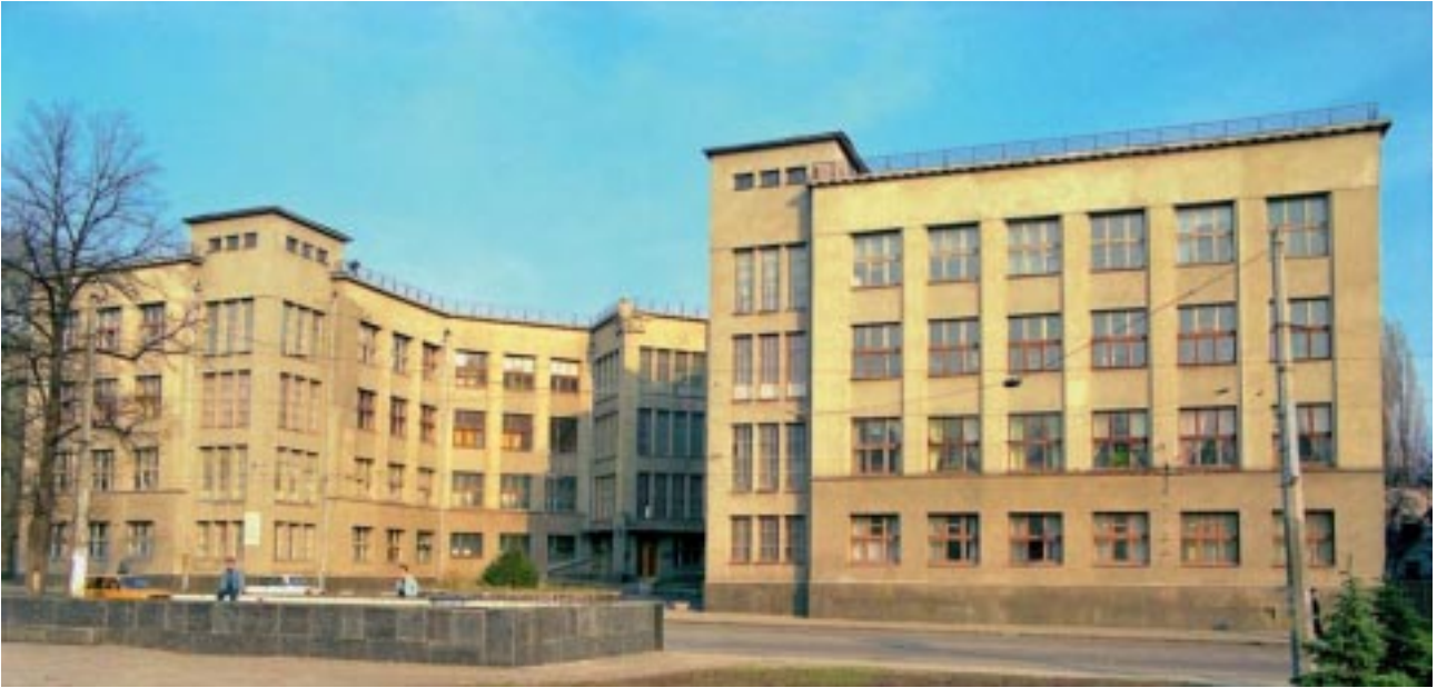
Інститут Медичної Радіології ім. С.П. Григор'єва

румів фахівців: 1-го Всесоюзного з'їзду онкологів, 1-го (1931 р.) і 2-го (1936 р.) українських з'їздів рентгенологів і радіологів у Харкові; Української наради з планування науково-дослідної роботи в онкології та рентгенології (1934 р.) у Києві. Г.О. Хармандар'ян був активним учасником багатьох міжнародних з'їздів (у Мадриді, Цюріху), де виступав з доповідями і очолював радянські делегації. Його портрет і коротка біографічна довідка разом з відомостями про інших дев'ятьох харківських рентгенологів ввійшли до ілюстративного каталогу учасників міжнародного радіологічного конгресу, виданого в Стокгольмі в 1928 р.